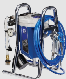
Ref. Ud/caja N002007 1