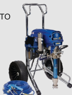
Ref. Ud/caja N002011 1