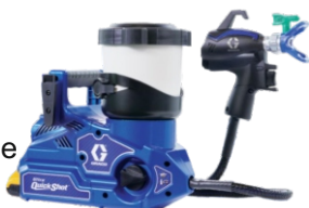
Ref. Ud/caja N002031 1