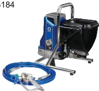
Ref. Ud/caja N002009 1