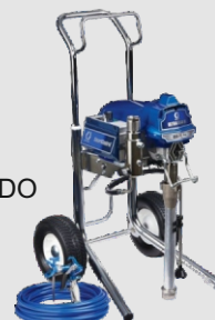
Ref. Ud/caja N002032 1