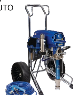
Ref. Ud/caja N002012 1