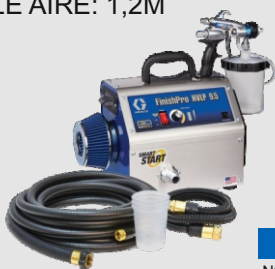
Ref. Ud/caja N002027 1