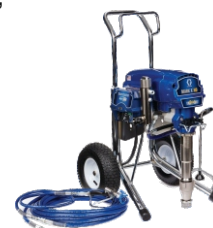
Ref. Ud/caja N002042 1