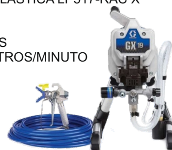
Ref. Ud/caja N002047 1