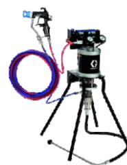
Ref. Ud/caja N002028 1