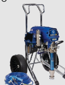
Ref. Ud/caja N002010 1